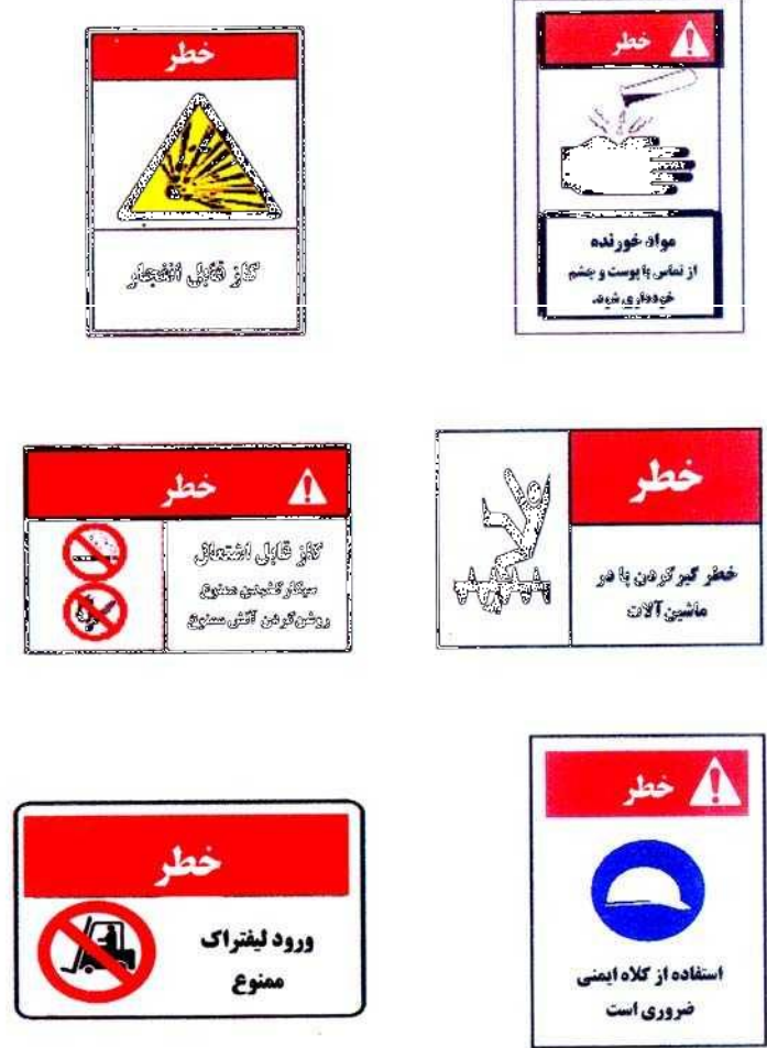
این علائم به عنوان نمونه آورده شده است، جهت اطلاع بیشتر به کتاب "علائم ایمنی در کارگاهها" مراجعه شود.